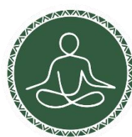
MEDITACIÓ DE LA MUNTANYA

Bifurcació de camins , seguir la pista formigonada avall : direcció Espinalbet pel Camí de Corbera