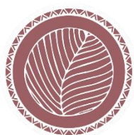
CONNECTANT AMB LA TERRA

(Clica el punt de la pràctica que vulguis per enllaçar a l'àudio de l'Spotify)