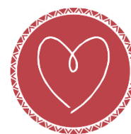
OBRINT EL COR

2,9 km (1.417 m), 1h 17 min. Planells del Serrat de la Figuerassa.