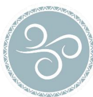
EL QUÈ ENS PORTA L'AIRE