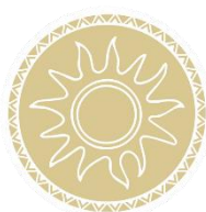
LLUM DE VIDA

(Clica el punt de la pràctica que vulguis per enllaçar a l'àudio de l'Spotify)