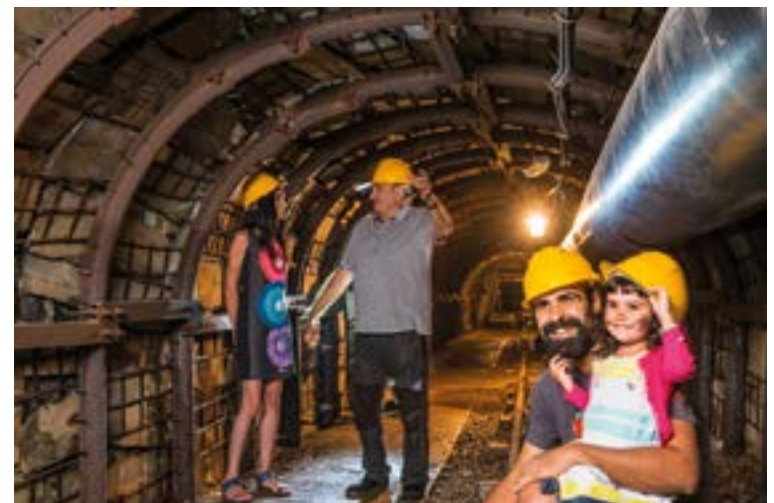
Museu de les Mines de Cercs.

Este descenso poblacional respondía a una regresión de los sectores industriales que concentraban la mayor parte de la actividad económica y de la ocupación.