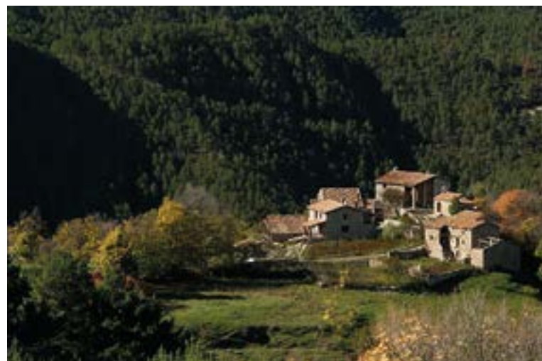
Molers, en Saldes.

Desde entonces, la oferta turística y de ocio vinculada a la naturaleza ha ido creciendo hasta convertirse en la principal motivación de la gente que nos visita. Así, lugares como las fuentes del Llobregat, la Dou del Bastareny, los Empedrats, la Gallina Pelada o el mismo Pedraforca compiten por llevarse el máximo número de visitantes, al mismo tiempo que lo hacen también por mantenerse lo más preser-