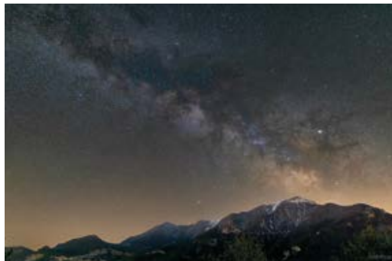
Via Láctea sobre la Gallina Pelada.

El paseo por el entorno del Pedraforca ofrece rincones y puntos sor-