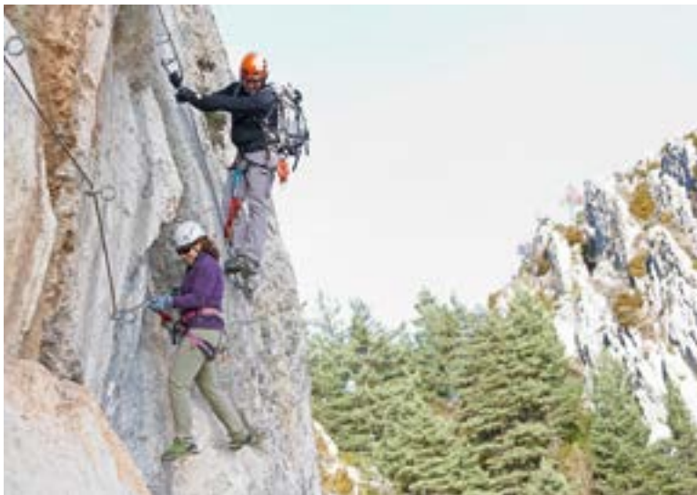
Via ferrata, Roques d'Empalomar.

La oferta es interminable y la lista de opciones para practicar todas estas modalidades es larga. Otros deportes, como las carreras de orientación ganan fuerza y empiezan a aparecer circuitos regulados, así como la evolución constante que tienen las carreras de montaña y que han propiciado la creación de un circuito fijo como es la Estación de Trail, situada en el alt Berguedà e integrada por los municipios de Bagà, Guardiola de Berguedà, la Pobla de Lillet, Sant Julià de Cerdanyola y la Nou de Berguedà. La Estación tiene treinta rutas disponibles, son recorridos señalizados y geolocalizados y que, por colores, marcan su nivel de dificultad. En total, son 475 kilómetros marcados en diferentes circuitos que oscilan entre los 7 y los 85 kilómetros, haciéndolo así apto para todo tipo de corredores. Las carreras de montaña tienen en el Berguedà, sin duda, un escenario ideal con pruebas de renombre internacional ya consolidadas como son la UltraPirineu o el UltraCatllarès