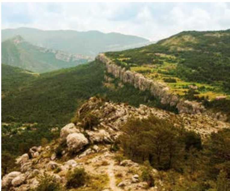
Riscos de Vallcebre.