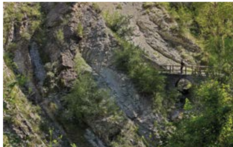
Via del Nicolau, en Bagà.

En todo caso, este territorio no sólo se nutre de naturaleza pura, sino también de su combinación con elementos patrimoniales como iglesias, castillos, antiguos caminos o patrimonio industrial hoy reconvertido en centros de interpretación o museos que nos permiten revivir nuestra historia desde hace 65 millones de años –cuando los dinosaurios poblaban estos rincones– hasta la historia más reciente del cierre de las minas de carbón.