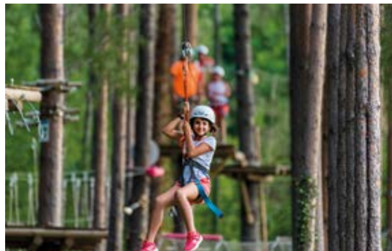
Parque de aventura.

y otras que se están haciendo un hueco en el panorama de las mejores carreras como son la Ensija Trail y el Trail del Moixeró. Los mejores corredores del mundo hace años que han descubierto estos caminos y por ahí compiten temporada tras temporada.