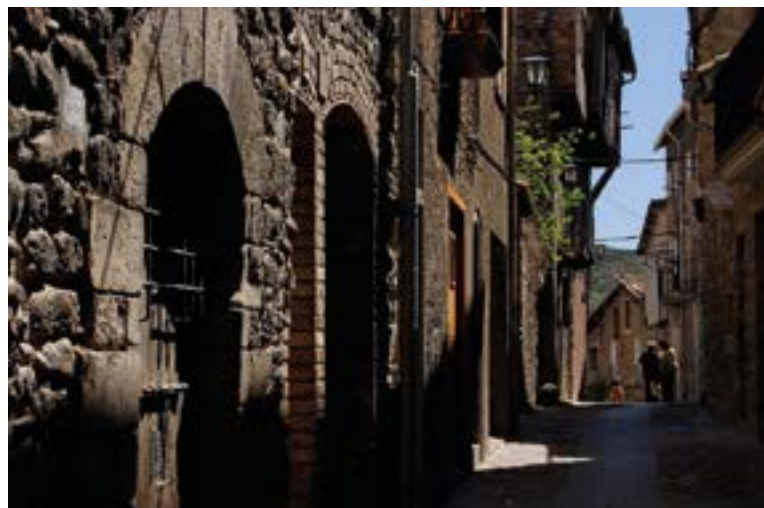
Centro histórico de Bagà.

El atractivo de Bagà gira, en gran parte, alrededor de su pasado medieval y de la presencia de los cátaros, bien detallados en el Centre Medieval i dels Cátars (38) pero más allá de la villa hay otros espacios con un atractivo notable. Es el caso del Monestir de Sant Llorenç (40) , situado al norte del núcleo urbano de Guardiola de Berguedà. Se trata de un anti-