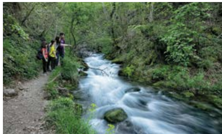
El Bastareny.

Más allá de la Dou, el Bastareny ofrece diversos rincones donde detenerse y disfrutarlos. Son saltos de agua naturales, aliviaderos poco visitados, que se encuentran muy cerca el uno del otro de manera que