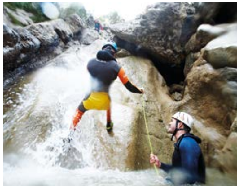
Barranco Forat Negre, Vallcebre.

En todos los casos se trata de modalidades en que es importante ser cuidadoso y respetuoso con el entorno y con las condiciones de estas propuestas, tanto en cuanto al material, como los permisos, como la necesidad de tener un guía. Es el caso también de la espeleología, en que la zona cercana al Pedraforca disfruta de una oferta muy rica. En Saldes hay el Graller de Roca Cerdana y el Graller de Carbasser , y en Gisclareny l' Avenc (la Sima) de l'Antic Bullidor . Roca Cerdana es un tubo vertical de casi cien metros, una sima pura; el Graller de Carbasser, también conocido como Avenc dels Escaladors, se encuentra en el Pedraforca mismo y tiene unos 170 metros de desnivel y unos 480 de recorrido; l'Avenc de l'Antic Bullidor, por su parte, tiene una profundidad de 188